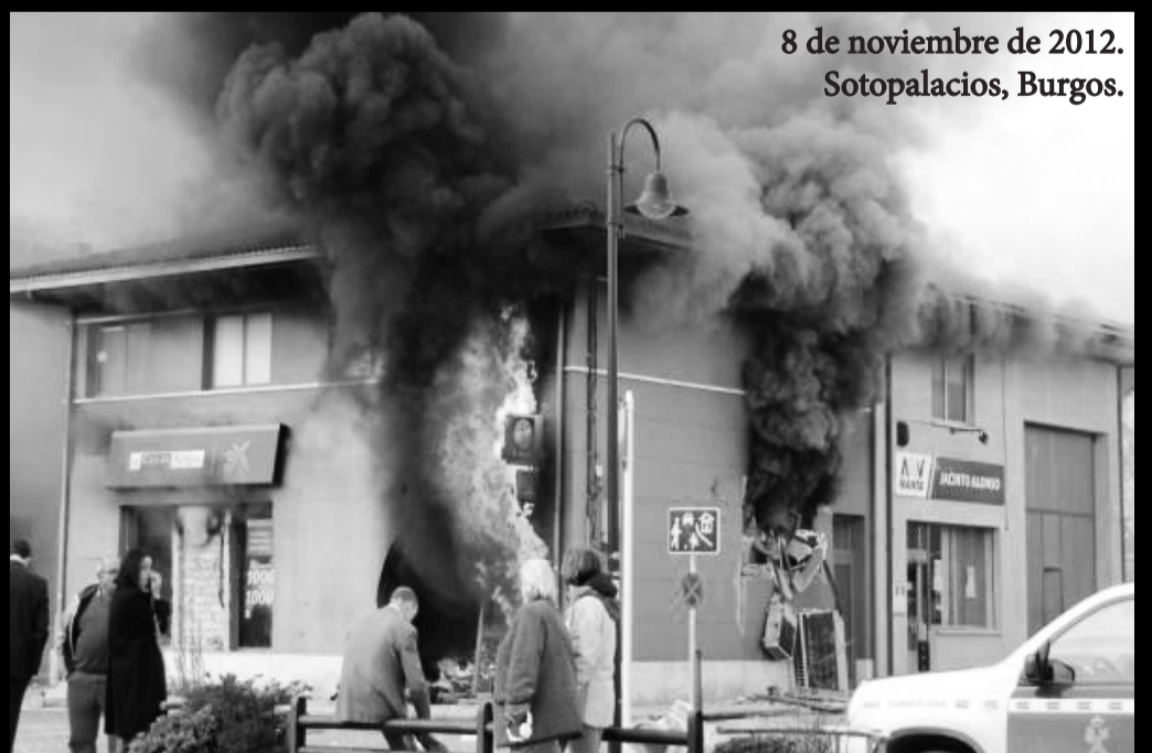
8 de noviembre de 2012. Sotopalacios, Burgos.

2. Hace unos días el suicidio de la esposa de un ex concejal socialista de Barakaldo (municipio de Bizkaia), que también estaba a punto de ser desahuciada, ha dado qué hablar en la prensa burguesa. Hablando sobre todo de los “cambios legales” que tendrían que haber para evitar estas “trágicas situaciones”. Una especie de antesala a las reformas anunciadas estos días por el gobierno en un intento por calmar la opinión pública.